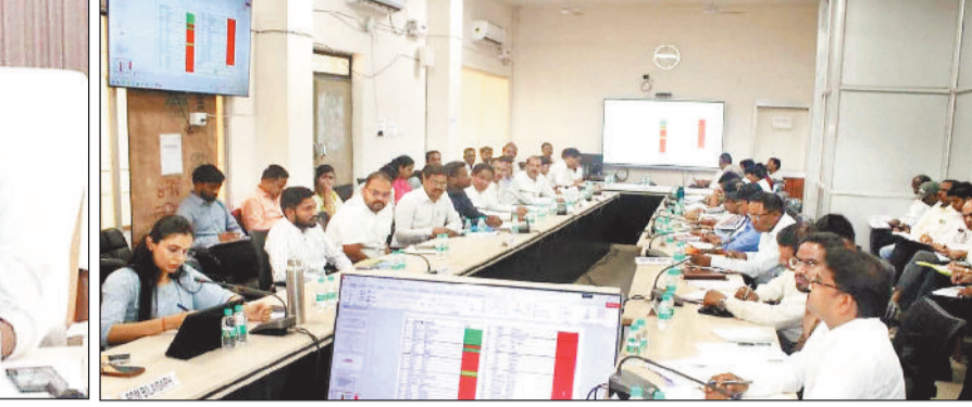
अधिकारियों की बैठक लेते कलेक्टर।

जूटमिल के बीच संपर्क की जानकारी मिलने पर पुलिस ने इस दिशा में जांच आगे बढ़ाई। लुगता प्रयास और मुखबिर तंत्र के माध्यम से दोनों के पंजाब के जालंधर में होने की सूचना मिली, जिस पर तत्काल पुलिस टीम को रवाना किया गया। टीम ने वहां पहुंचकर बालिका को आरोपी के कब्जे से सक्षुशल बरामद किया। बालिका के कथन, मेडिकल पर आरोपी द्वारा नागालिग