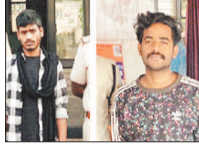
■ दोनों मामलों में आरोपियों पर पोक्सो एक्ट के तहत कार्रवाई, न्यायिक रिमांड