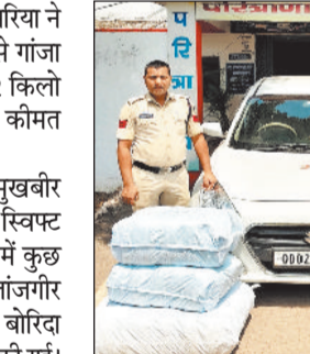
गवाहों के समक्ष स्विफ्ट डिजायर कार की तलाशी लेने पर कार के अंदर 59 पैकेट में कुल 62 किलो