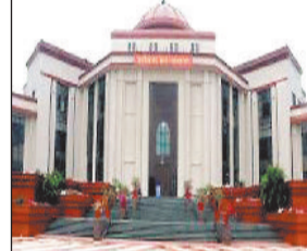
■ प्रेसिडिंग-ऑफिसर से 15 दिन में मांगा जवाब, पूरा मामला रायगढ़ फैमिली कोर्ट का